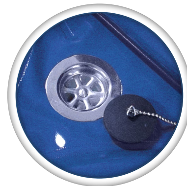
Bonde d'évacuation simple d'utilisation. Plan incliné à 2°

Structure en acier métal peint anticorrosion