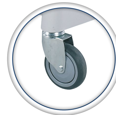
Freinage centralisé en option avec 4 roues Ø 125 mm, dont 1 directionnelle.